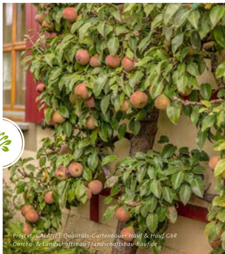
Projekt: GALANET-Qualitäts-Gartenbauer Hauf & Hauf GbR Garten- & Landschaftsbau | landschaftsbau-hauf.de