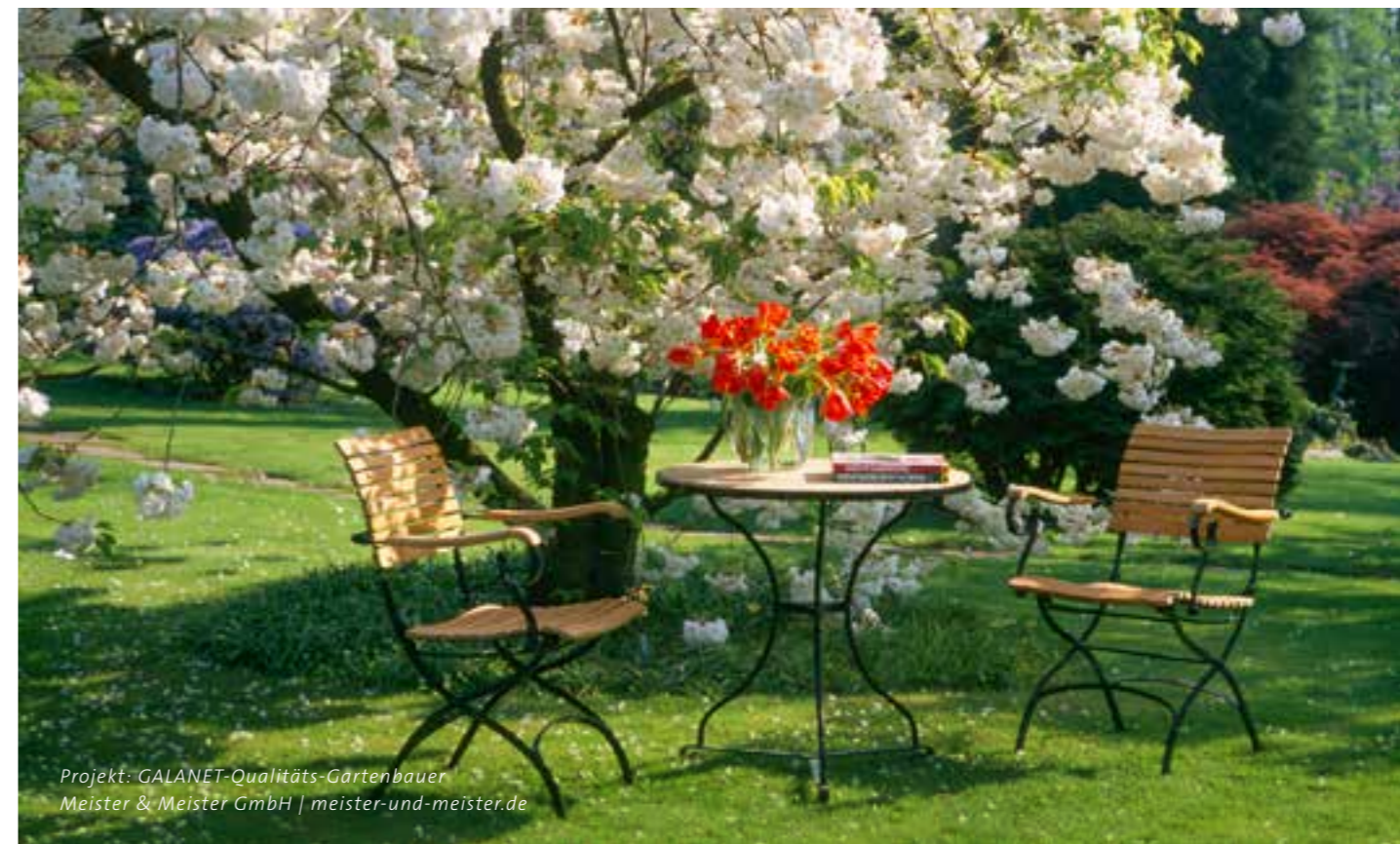
Projekt: GALANET-Qualitäts-Gartenbauer Meister & Meister GmbH | meister-und-meister.de