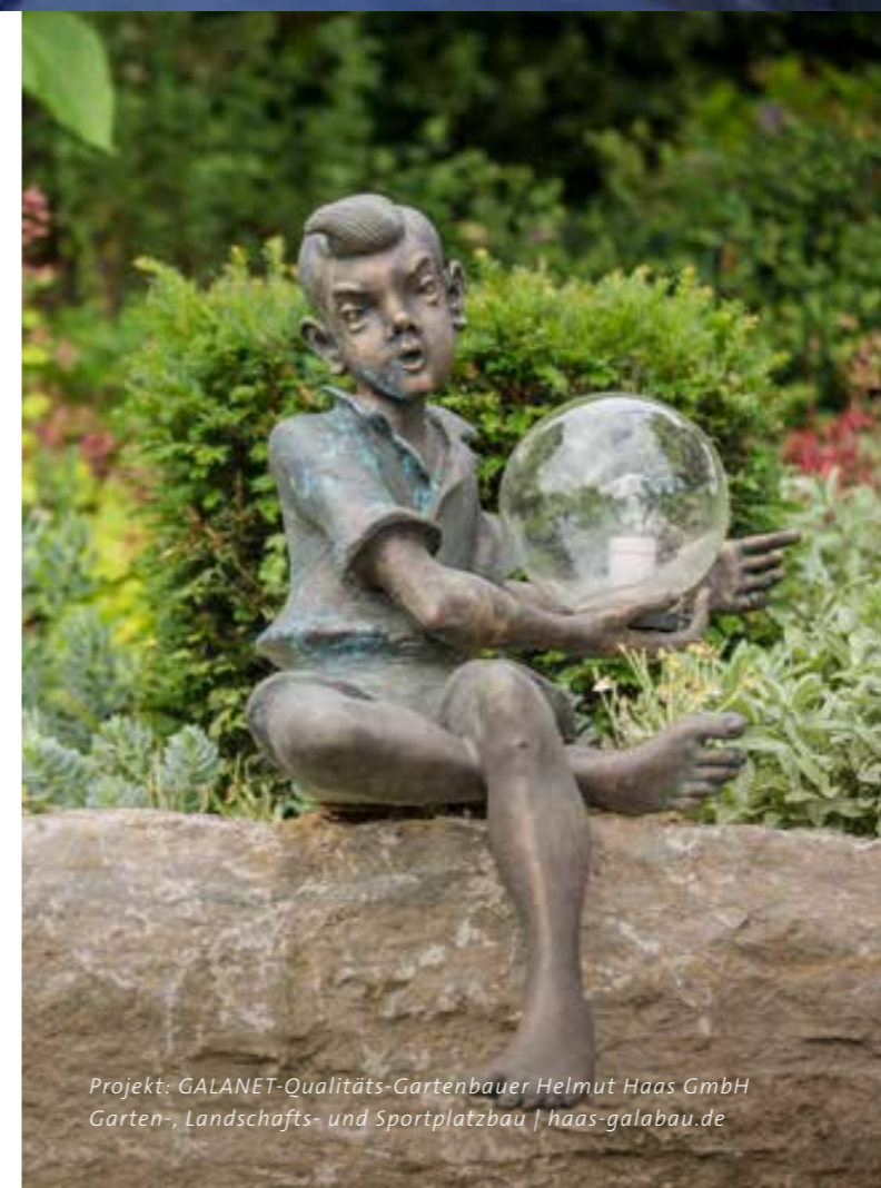
Projekt: GALANET-Qualitäts-Gartenbauer Helmut Haas GmbH Garten-, Landschafts- und Sportplatzbau | haas-galabau.de

Um Ihren Garten auch nach Einbruch der Dunkelheit weiter strahlen zu lassen, muss nicht die gesamte Fläche beleuchtet werden. Perfekt geplant und fachmännisch umgesetzt, tanzen Licht und Schatten leichtfüßig über Grünflächen, Blumenbeete, Terrassen und Wasseroberflächen.