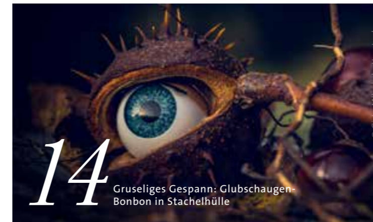
Gruseliges Gespann: Glubschaugen-Bonbon in Stachelhülle