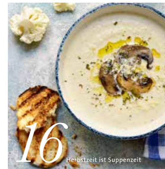
16 Herbstzeit ist Suppenzeit

Redaktion & Layout: FFI Agentur | ffiagentur.de ingruen@ffiagentur.de