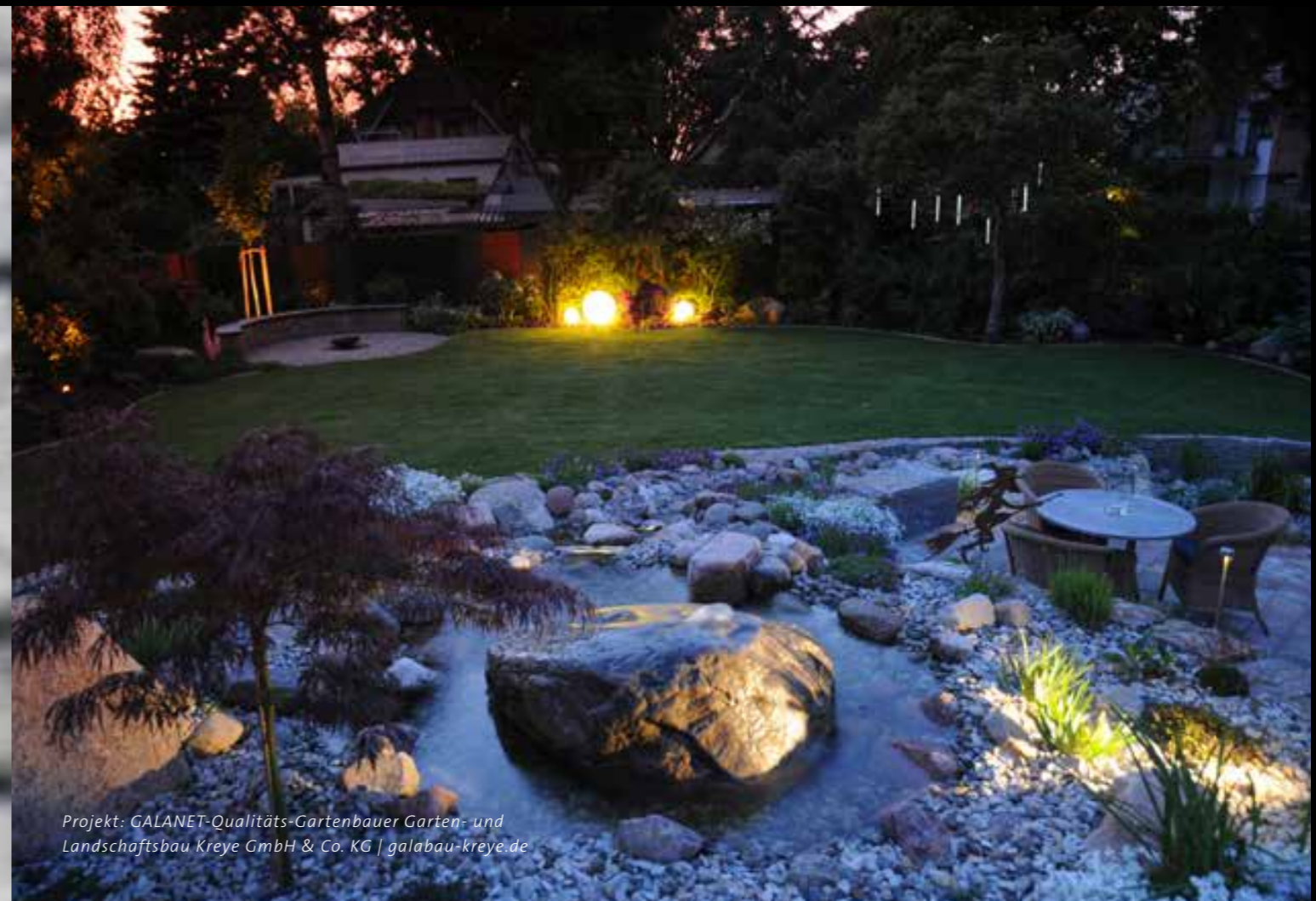
Projekt: GALANET-Qualitäts-Gartenbauer Garten- und Landschaftsbau Kreye GmbH & Co. KG | galabau-kreye.de